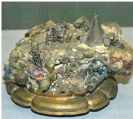
Handstein z roku 1674 zo Španej Doliny. Zo zbierok múzea v Siegene.

bane, tvorený z rýdzej medi, ktorá prešla prvou tavbou. Meď pochádza tak isto zo Španej Doliny. Ľubietovú prezentujú minerály pseudomalachit, libethenit a euchroit, pričom posledné dva spomínané minerály sa prvýkrát pre svetovú mineralógiu v roku 1823 popisali práve z tohto baníckeho mestečka. Z tohto okolia, konkrétne z Povrazníka sa tu nachádzajú aj vzorky drevného opálu, ktorý sa svojou kvalitou v týchto ukážkach radí k polodrahokamom a je vhodný na výrobu rôznych šperkov. Na dotvorenie celkovej scenerie diela boli použité aj minerály pochádzajúce z Banskej Štiavnice, konkrétne galenit, chalkopyrit a sú tu aj kryštály kremeňa.