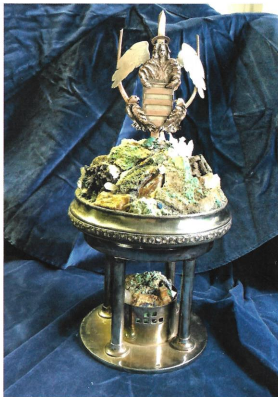
Handstein 2018, Banská Bystrica.